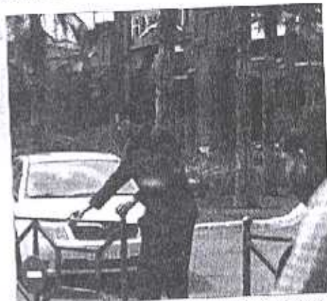
Douze heures de travail par jour sans la moindre pause, même pas le temps pour aller aux toilettes.

Cette veuve, chargée de trois enfants, et toutes ses collègues, ne bénéficient que d'une seule journée de repos par quinzaine. Si, par malheur, l'une d'elle tombe malade ou s'absente pour une raison ou une autre, son salaire sera imputé de 100 DH pour chaque journée d'absence (alors que son salaire quotidien moyen s'élève à peine à 28,5 DH). Si les aberrations d'ordre financier sont plus ou moins endurables, d'autres dépassements sont très dus à avaler. En effet, et selon les témoignages de plusieurs agents, les employés intérimaires sont traités comme des moins que rien de la part de leurs supérieurs. Certains responsables, peu scrupuleux, les obligent à leur céder une partie de leur salaire contre des postes de travail moins contraignants, ou s'excusent pas beaucoup d'efforts. «D'autres, que je qualifie de charognards, demandent carrément un mois de salaire pour nous faciliter l'embauche. Déjà, nous n'arrivons pas à nous en sortir avec des salaires très bas, sans qu'ils nous demandent, en plus, rien de bien sûr (mais c'est une pratique courante), une «taxe» sur nos salaires», souligne Abderrazak, qui a bien reçu sa bosse dans le domaine et se dit très informé des vicissitudes et des pratiques maladroites du secteur. «Nous ne sommes payés qu'un bout du salaire ou du septième